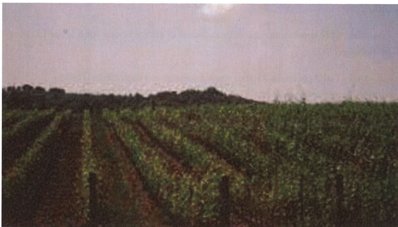
Immagine di repertorio

Serve per incentivare le imprese agricole a concludere il ciclo produttivo e quindi dare maggiore stabilità al sistema economico agricolo aretino